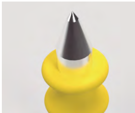
Ponta do pino modelo adulto.