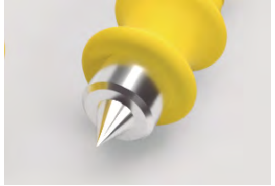
Punta del pin modelo pediátrico.