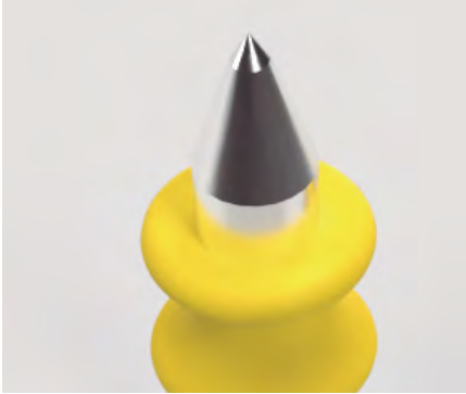
Punta del pin modelo adulto.